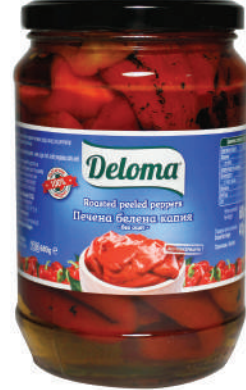
Печена белена капия