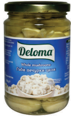
Гъби печурки цели